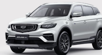
Crystal White Белый