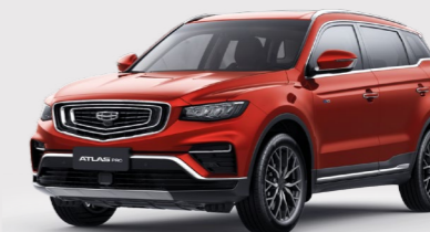
Flame Red Красный металлик