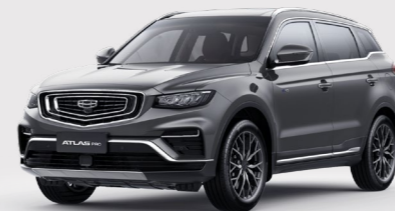
Titanium Grey Серый металлик