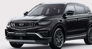
Ink Black Черный металлик