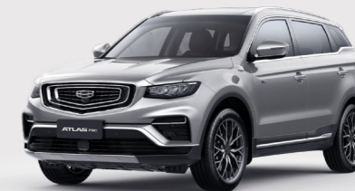
Pearl Silver Серебристый металлик